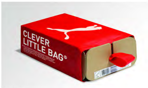
Clever Little Bag

PUMA was a proud winner at the Conde Nast Traveller 2011 Innovation and Design Awards held at the St Pancras Renaissance Marriott Hotel in London on May 10. The awards were created to honor the best in innovative design and thinking and recognize achievements in a wide variety of categories. The winners were selected by Traveller readers based on nominations by a team of experts.